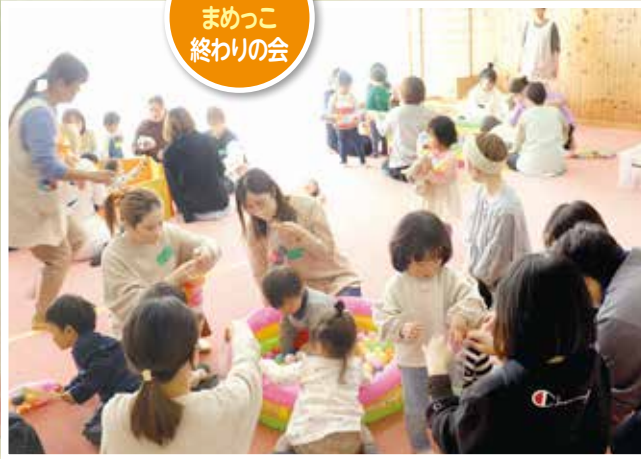
3/16 まめっこ 終わりの会