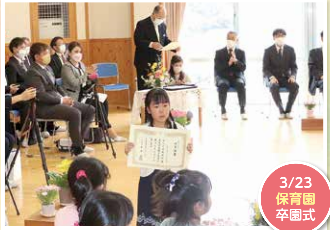
3/23 保育園 卒園式