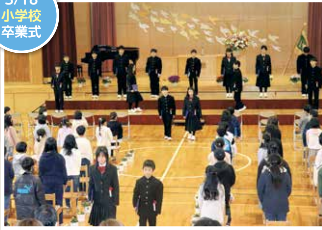
3/18 小学校 卒業式