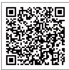
▲危険木等伐採事業補助金

この補助金は、伐採に着手する前に申請する必要があります。詳細は問い合わせてください。