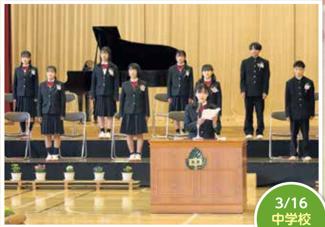
3/16 中学校 卒業式