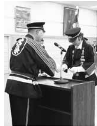
▲退団任命式の様子

啓蒙活動に努め「地域の防災の要」となれるよう、より一層尽力していきたいと思っております。