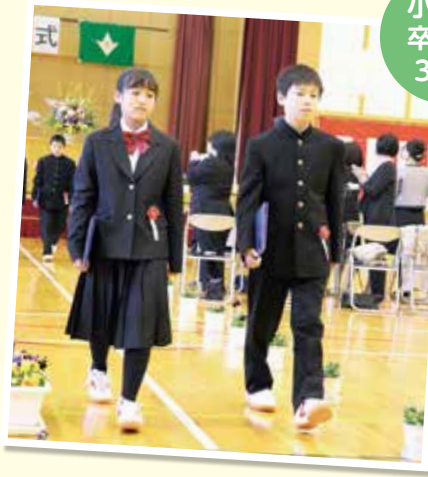
小学校 卒業式 3/17