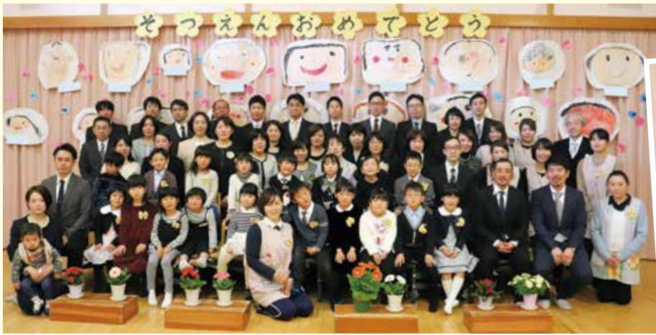
保育園 卒園式 3/19