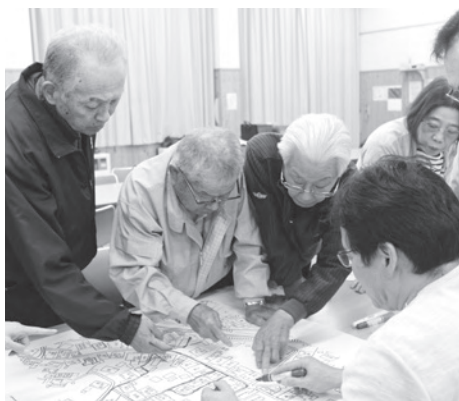
▲地区の水路を確認する参加者

次回講座は12月15日に行われ、地区内の要援護者のリストアップや、避難経路の確認などが行われる予定です。