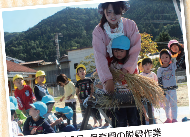
10月10日 保育園の脱穀作業