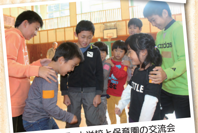
10月31日 小学校と保育園の交流会