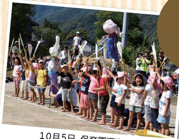
10月5日 保育園運動会