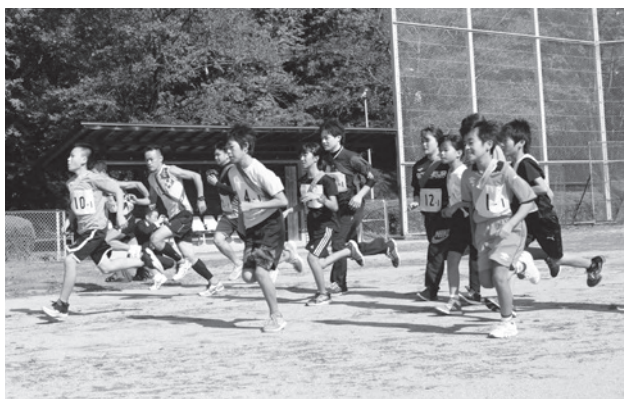
▲スタートを切ったランナーたち