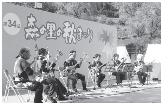
▲大桑村ヒノキ三味線クラブ「檜弦」の演奏