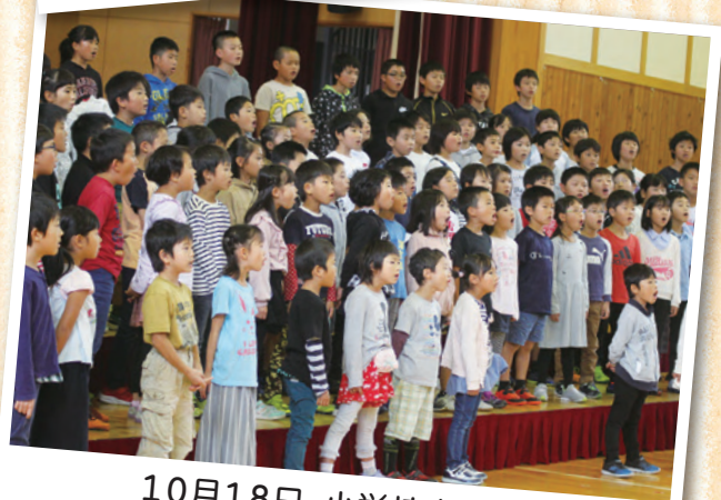
10月18日 小学校音楽会