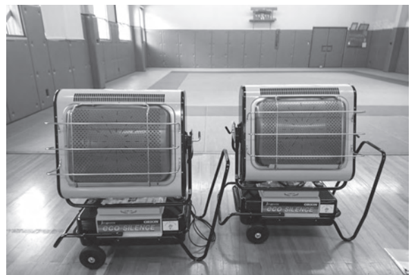
▲ジェットヒーター