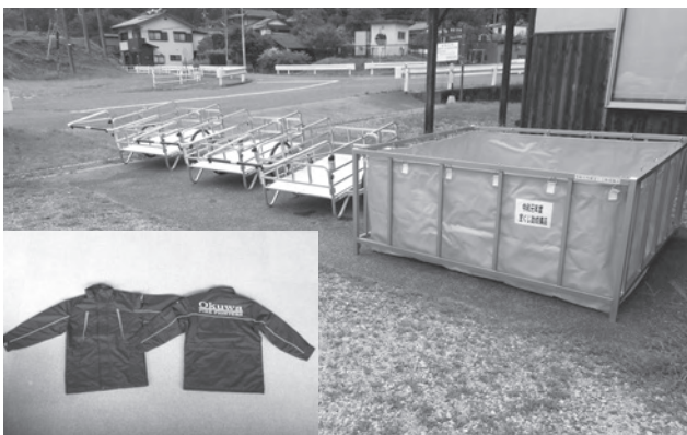
▲リヤカー、角形水槽、防寒着