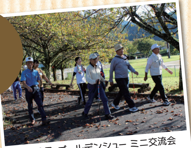
10月9日 ゴールデンショー ミニ交流会