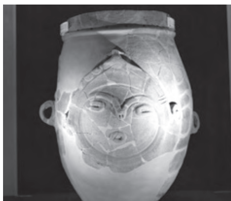
人面裝飾付有孔罎付土器

これは、昨年9月に「信州の特色ある縄文土器」の1つとして県宝に指定されたことを受けて愛称を募ったもので、村内外154人（うち小学生54人）から234点の応募が寄せられました。多数の応募ありがとうございました。