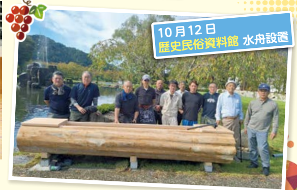
10月12日 歴史民俗資料館 水舟設置