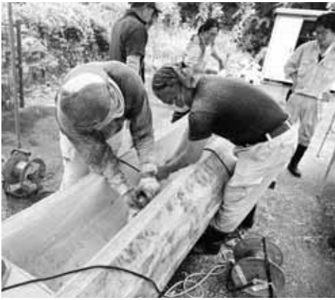
▲原木のくりぬき作業

作業は機械による現代の手法も取り入れつつ、細かい部分は鐮などを使った昔ながらの手作業で整え完成した直径60cm、長さ約3・5mの立派な水舟は、昭和を代表