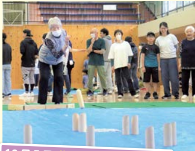
10月5日 分館対抗スポーツ大会 (モルック)