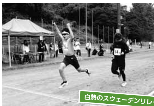
白熱のスウェーデンリレー

ボールパークでは、南木曽町と大桑村の小学生で構成される南木曽JBCと木曽郡内の中学生で構成されるオール木曽、木曽青峰高校野球部のメンバーが野球の普及を目指し、ボールを捕る、投げる、打つ楽しさを小さな子どもやクラブに加入していない小学生たちに熱心に伝え、笑顔と歓声があふれていました。