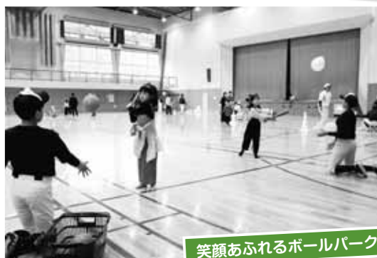
笑顔あふれるボールパーク

午後6時から、村内事業者を中心に協賛のあった450発の打ち上げ花火大会が行われました。雨による延期が心配されましたが、無事、秋の夜空に大輪の花が咲きました。