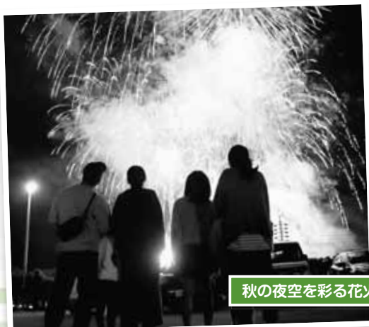
秋の夜空を彩る花火

午後6時から、村内事業者を中心に協賛のあった450発の打ち上げ花火大会が行われました。雨による延期が心配されましたが、無事、秋の夜空に大輪の花が咲きました。