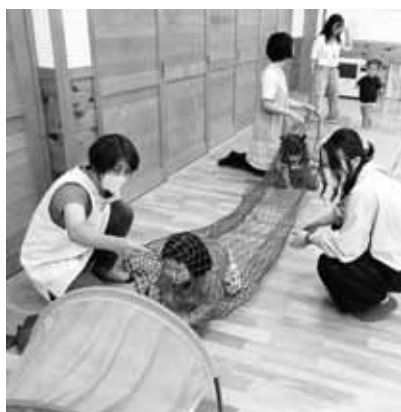
▲ 1歳児・2歳児参観日の様子

かしたり、スカーフを投げたり、キャッチをして素材遊びを楽しみました。2歳児はトンネルをくぐったり、バランスボールに乗って弾む感覚などを楽しみました。 回数を重ねることで、保護者同士の交流や子ども同士の間わりが広がってきています。