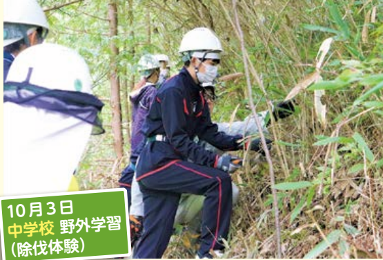
10月3日 中学校 野外学習 (除伐体験)