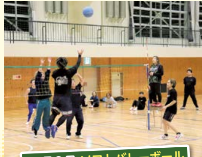
10月9日 ソフトボール リーグ戦開催!