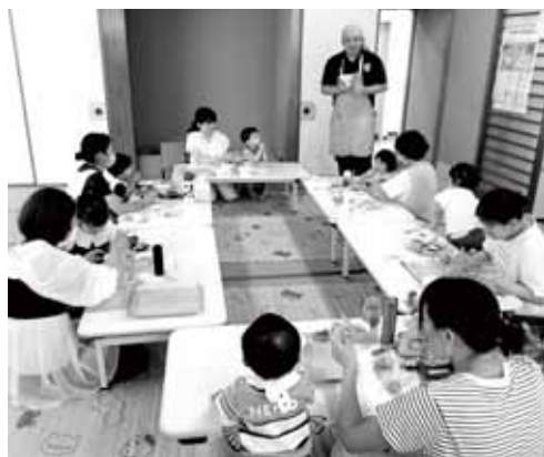
▲ 災害時非常食の試食

ほっとステップの畑で子どもたちと一緒に育て、収穫した野菜を使い、大根のガレット・オニオンスープ・ほうれん草のおやつ・おにぎり・カレー・災害時の非常食などの作り方を管理栄養士から教わり、利用者が作成にチャレンジしました。参加者は「こんな調理方法もあるんだ」と知らない調理方法に驚いたり、「普段、家ではあまり食べない」「野菜を食べるかな」と心配されていた保護者もいました。作っている所のいい匂いを嗅ぎながら「早く食べたい」と待ち遠しそうにしていた子どもたちのパクパクと夢中で食べる姿が印象的でした。