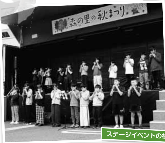
ステージイベントの様子

メインステージのイベントでは村の小学生によるコカリナ演奏や中学生の吹奏楽、郡内高校生のバンド演奏等が行われ、会場に響く多彩な音色に多くの来場者が魅了されました。