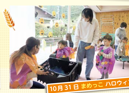
10月31日 まめっこ ハロウィンパーティー