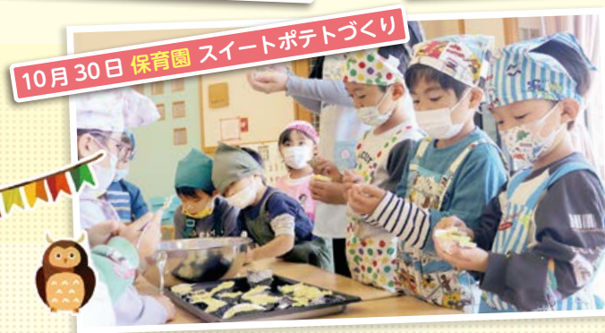
10月30日 保育園 スイートポテトづくり