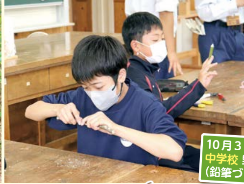
10月3日 中学校 野外学習 (鉛筆づくり体験)