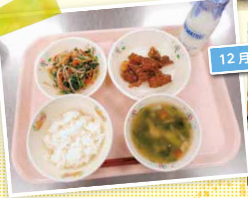
12月9日 有機給食の日 (小学校)