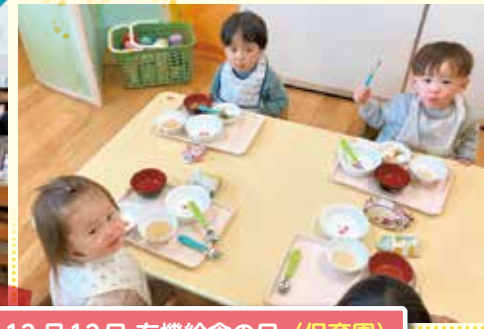
12月12日 有機給食の日 (保育園)