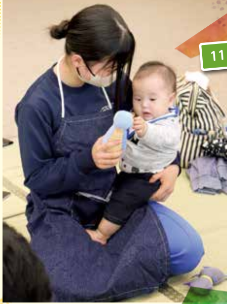
11月27日 中学校 乳幼児ふれあい体験