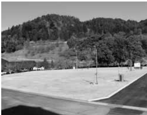
▲ 芝生整備された旧テニスコート