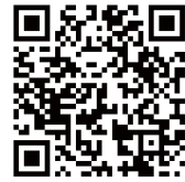
▲村HP (姉妹都市交流事業参加者募集)