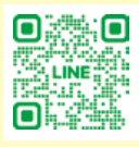
大桑村公式LINE 友だち追加はこちら

3月9日、社会福祉協議会が主催する「春の男性料理教室」に8名が参加し、春らしさとひな祭りにちなんだ春キャベツが入ったちらし寿司や、揚げないコロッケ、お吸い物のレシピを管理栄養士から教わりました。 「普段は料理しない」と言いながらも参加者は手際よく工程をこなすと、「簡単だけど美味しく作れた」「楽しかったのでまた作りたい」と話してくれました。 大好評のレシピは、6月号の保健だよりで紹介する予定です。お楽しみに！