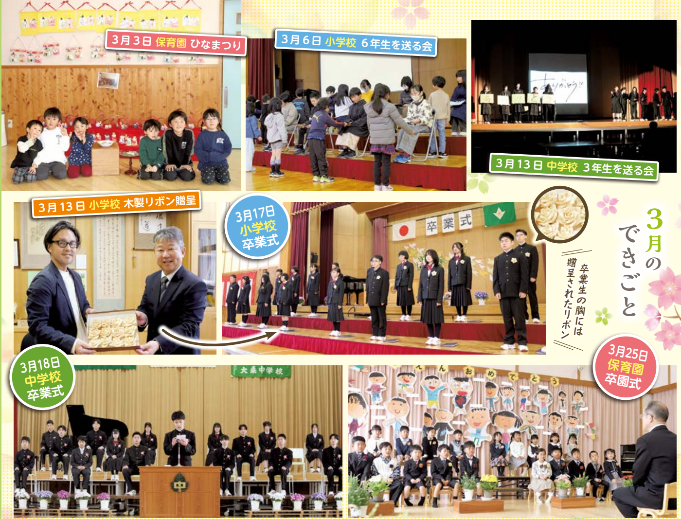
3月3日 保育園 ひなまつり