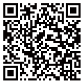
▲村HP (道路・河川整備交付金)