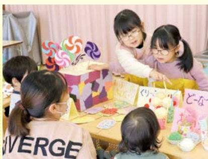
12月11日 保育園 おみせやさんごっこ