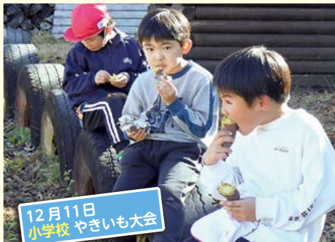
12月11日 小学校 やきいも大会