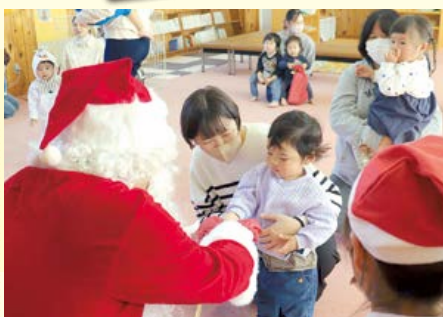
12月19日 まめっこ クリスマス会