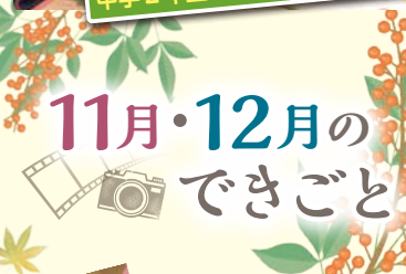
11月・12月の できごと