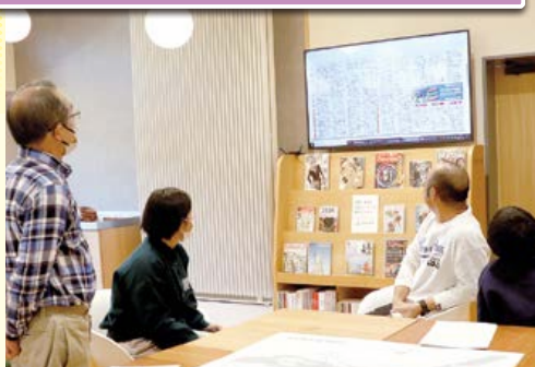
11月29日 大桑村の明日を語る集い（図書館レファレンスコース）