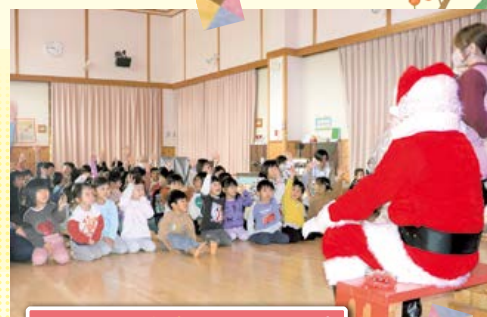
12月24日 保育園 クリスマス会