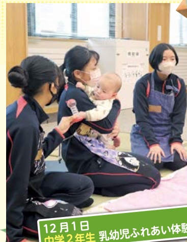
12月1日 中学2年生 乳幼児ふれあい体験