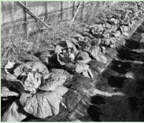
▲ 生育初期のハクサイ

しかし、ハウス管理が不慣れだったために、収穫まで順風満帆とはいかず。暖冬もあってか