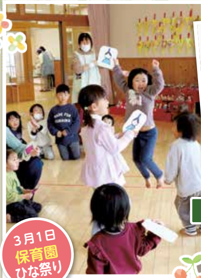
3月1日 保育園 ひな祭り