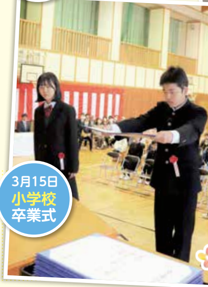
3月15日 小学校 卒業式