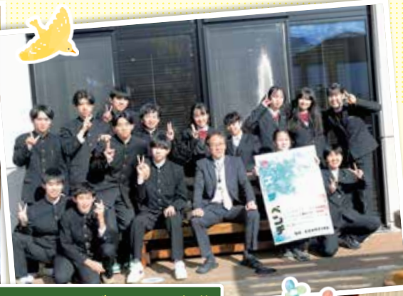
3月8日 キズナベンチ寄贈