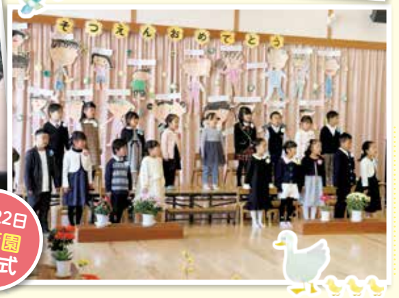
3月22日 保育園 卒園式